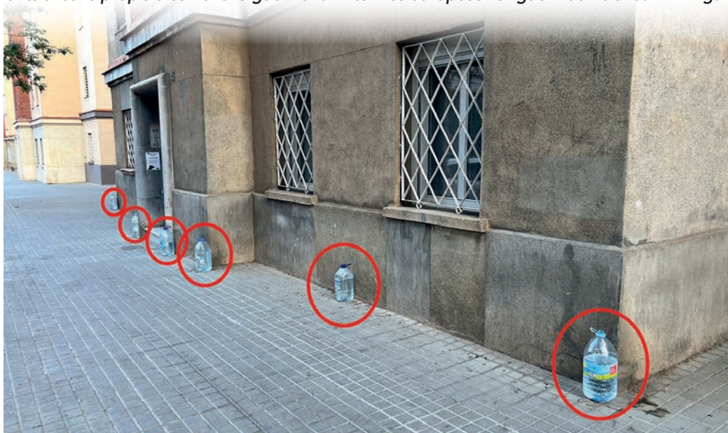
i encara falta una garrafa més, que no és veu a la foto

Tot passa però per que tinguem pràctiques més cíviques. Pensem en el que representa haver d'arreglar façanes i altres elements urbans propis o comuns. Siguem una mica més europeus i tinguem bonic el barri. Vinga va, som-hi!!!