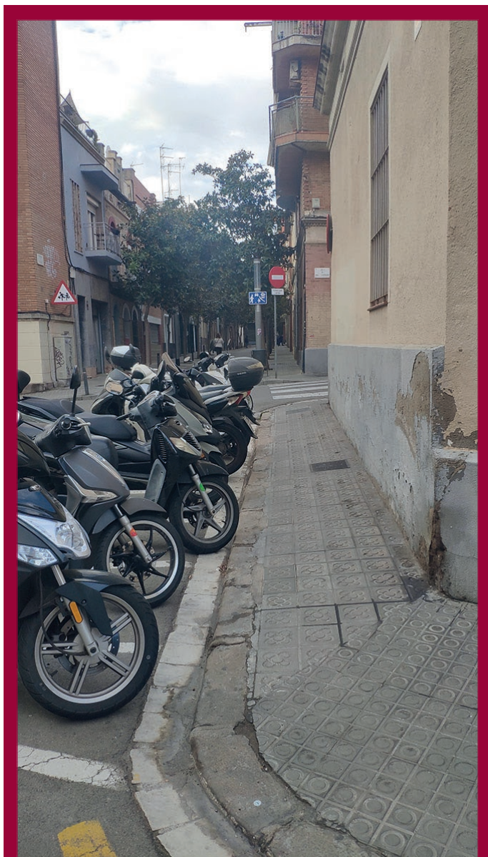
Una vorera mai arreglada per on no passa una cadira de rodes