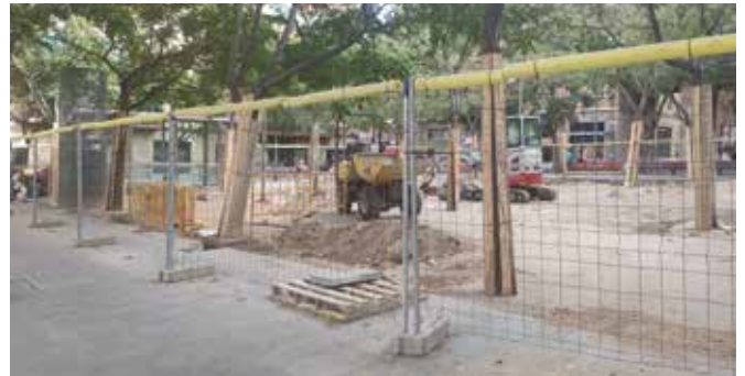
Plaça del Dr. Modrego