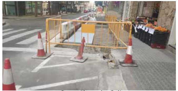
Carrer Alexandre Galí