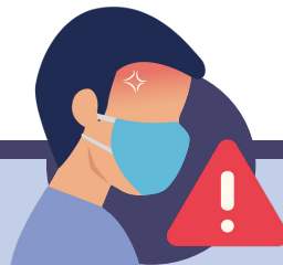
Empitjorament de malalties cròniques o conegudes