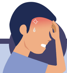
Febre alta, dolor intens, sagnat

El CUAP és la primera opció davant de problemes de salut no greus de baixa i mitjana complexitat , com ara: