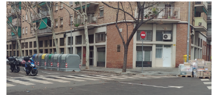
St. Pasqual Bailón - Riera d'Horta