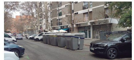
Riera d'Horta - Santapau