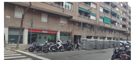
Riera d'Horta - Vèlia

Sembla mentida que al carrer Riera d'Horta, en les tres illes de les cantonades amb els carrers Vèlia, Santapau i Emili Roca hi hagi tres bateries de contenidors en la banda de Nou Barris i dues en la banda de Sant Andreu: un total de cinc bateries de contenidors (a cada bateria, n'hi ha dos de grisos, un de groc, un de blau i un de marró). Bé, creiem que és una exageració que cada cinquanta metres hi hagi una bateria de contenidors, TOT per la falta de comunicació entre districtes. Això frega l'insult als veïns i veïnes, que sembla que ens tractin de bruts i de rucs.