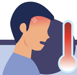
Malestar de moderat a intens