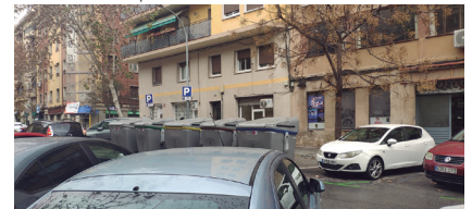
Riera d'Horta - Malgrat