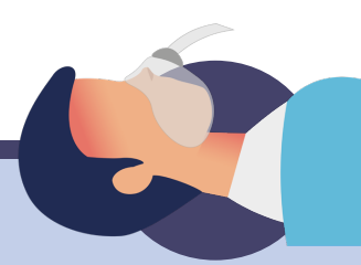
Situacions urgents per a les quals no sigui previsible l'ingrés.

L'atenció urgent de baixa i mitjana complexitat es resol abans als CUAP que a les urgències dels hospitals, on sempre tenen preferència els pacients amb urgències de risc vital.