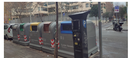
Riera d'Horta - Emili Roca